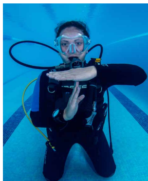
Mitad de carga, 100 atm