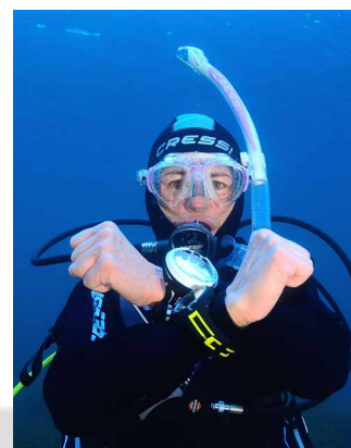
Fin de inmersión