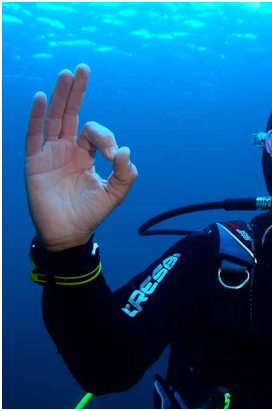
OK, bien, entendido