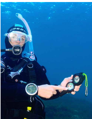
¿Cuánto aire te queda?