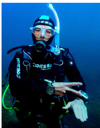
¿Cuánto tiempo queda de inmersión?