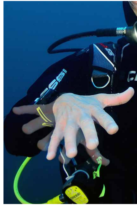
Problemas, algo no va bien!