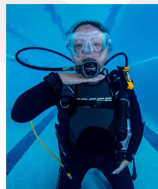
Sin aire, dame aire