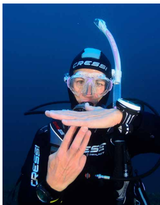
Parada a 3 metros