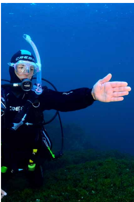
Dirección a seguir